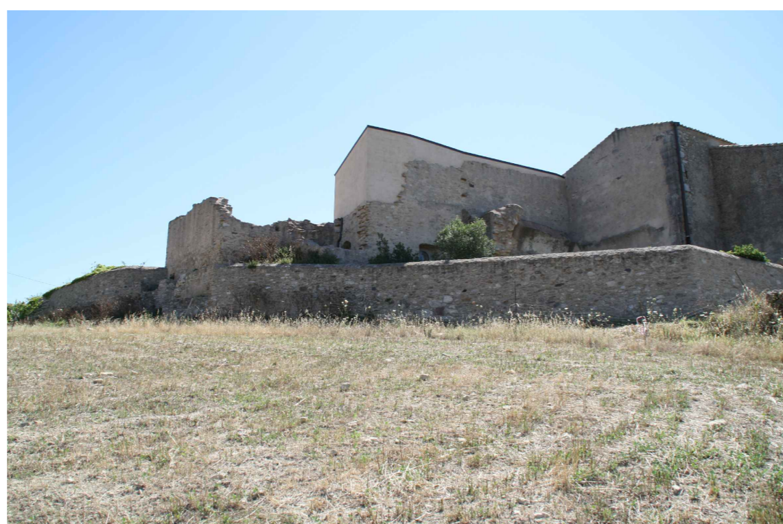
Vista posteriore delle coperture.

"PROGETTO DI RESTAURO CONSERVATIVO DELLA CHIESA MADONNA DEL SACRO CUORE DI GENONI"