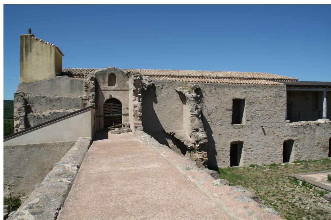
Coperture delle varie strutture.